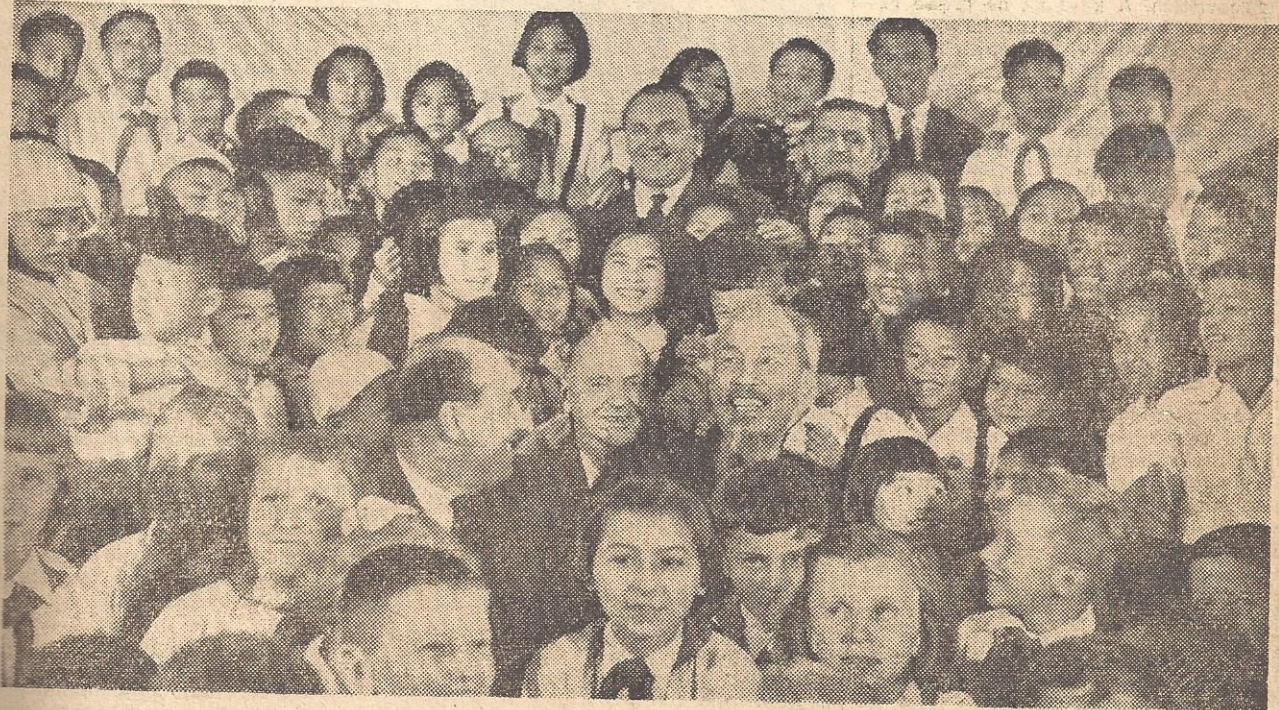
Mnoho bylo radosti mezi vietnamskými dětmi ze setkání se »strýčkem Ho«