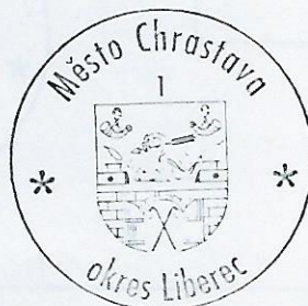
Zita V á c l a v í k o v á místostarostka